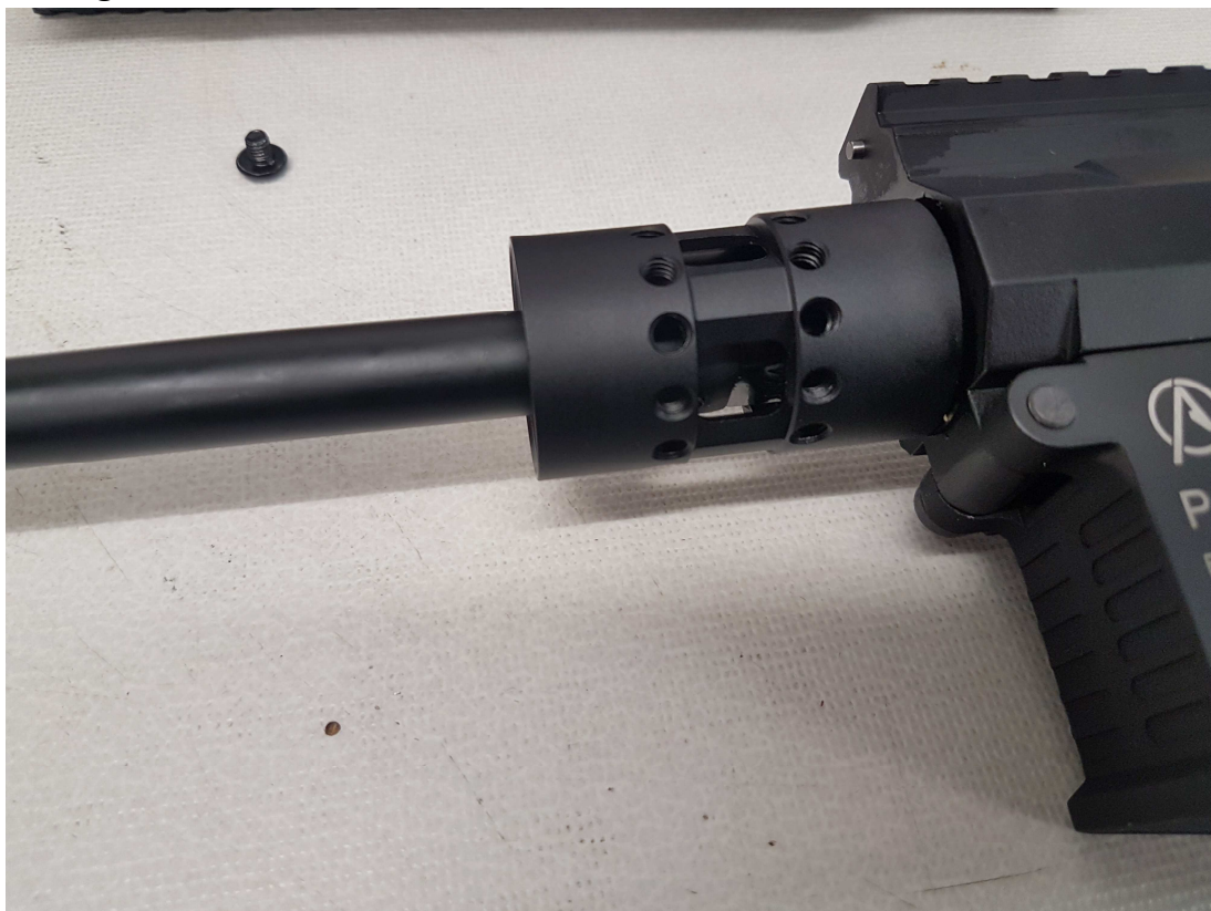
Aufschrauben des Montageringes auf den Body der Waffe